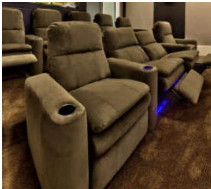
Figura 02 – Foto poltrona proposta: Modelo sugerido: Paris – Casa de Cinema ou similar

As poltronas deverão possuir estrutura de compensado naval e madeira maciça certificada; mecanismo para reclinar a poltrona; mantas siliconizadas; molas em aço carbono temperado; Espuma soft HP 33; tecido SWI Suede Italiano impermeabilizado – cor a definir;