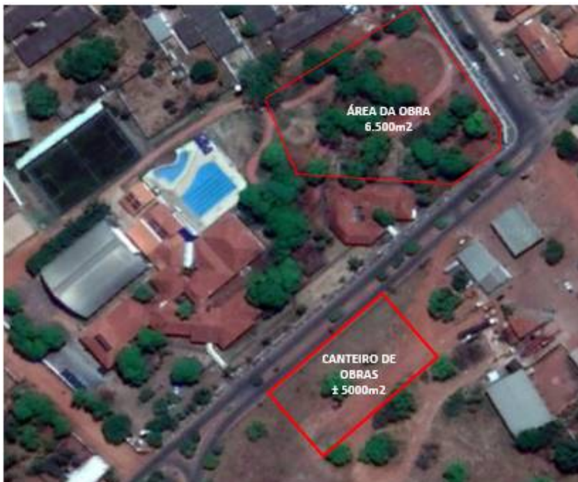
Figura 1 - Macrolocalização

A obra está localizada em uma área de aproximadamente 6.500 m 2 dentro do Centro de atividades do Sesc Poconé, conforme indicado na Figura 1 – Macrolocalização , esquina da Avenida Dom Aquino com Avenida Generoso Ponce, no município de Poconé, MG.