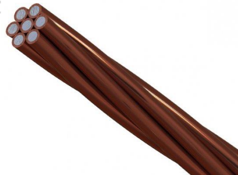
CABO DE AÇO COBREADO