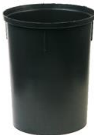
CAIXA DE INSPEÇÃO