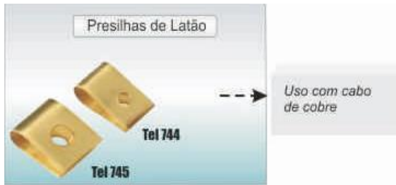
PRESILHAS DE LATÃO