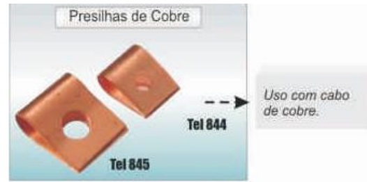
PRESILHAS DE COBRE