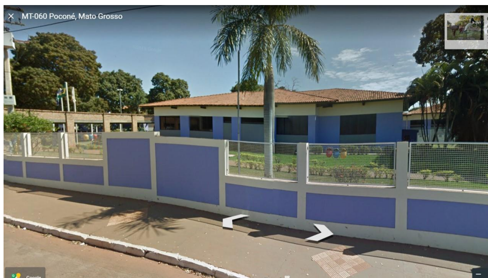
Figura 4 - Grades existentes