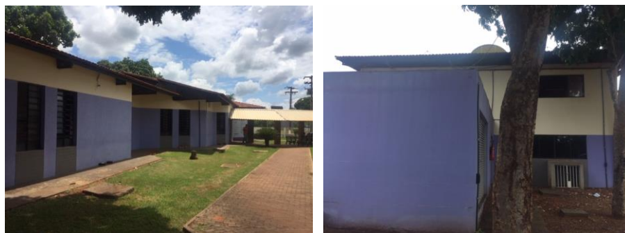
Figura 2 - Pintura em azul a ser coberta

Deverá ser realizado o lixamento de toda a superfície existente na cor azul que será coberta pela tinta Camurça ou Dubai e depois feita a limpeza com água para remoção dos resíduos, a fim de dar bom acabamento e homogeneidade final à nova cor especificada.