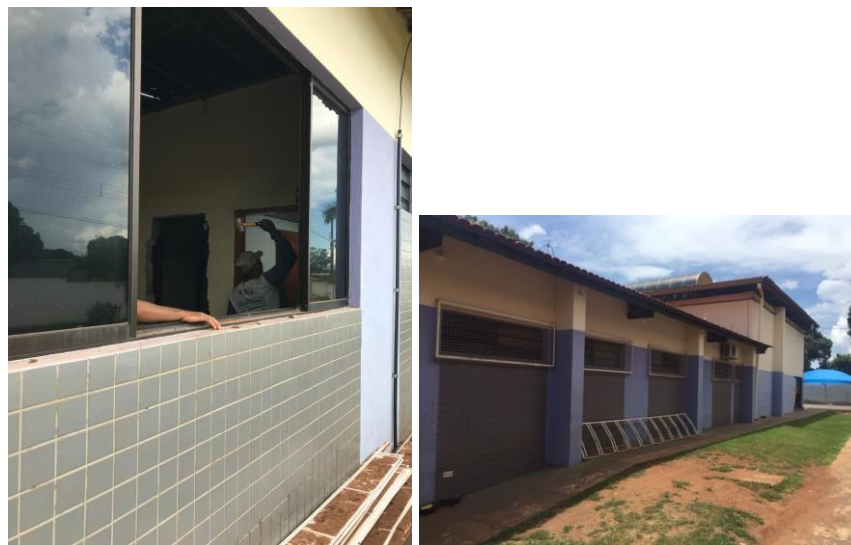
Figura 1 - Azulejos sob esquadrias a serem removidos

Todos os azulejos cerâmicos em fachadas deverão ser removidos.