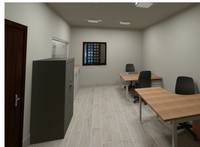
6 Vista 05 1 : 1