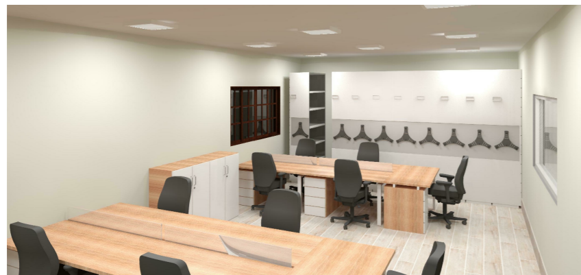
4 Vista 03 1 : 1