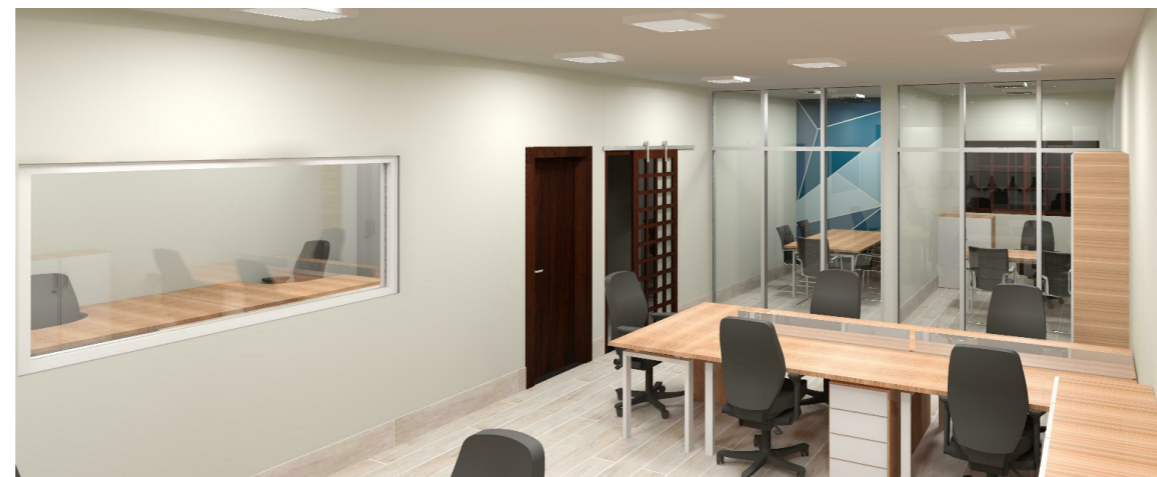
5 Vista 04 1 : 1