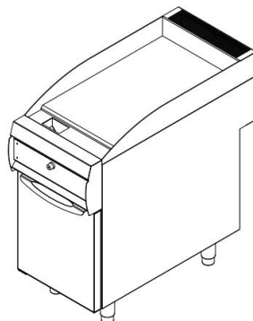
Figura 1 - Foto Meramente Ilustrativa