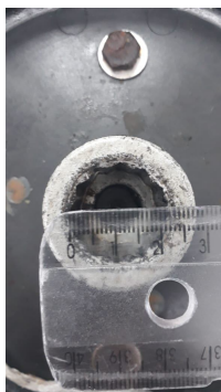
Foto do bocal