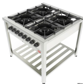
Figura 2 - Foto Meramente Ilustrativa

com 295mm de diâmetro ou cachimbo com 100mm de diâmetro, e grelhas de 425x425 mm em ferro fundido. Com manípulos em baquelite individuais com ajuste gradual de chama. Pannel com gravação à laser. Que contenha bandeja inferior coletora de resíduos, tipo gaveta. Com prateleira inferior gradeada. Consumo aproximado de 4,20 kg/h, potência de 195.836 BTU. Pressão do Gás GLP: 285mmCA / GN 200mmCA. Dimensões aproximadas: 1000x1000x900mm.