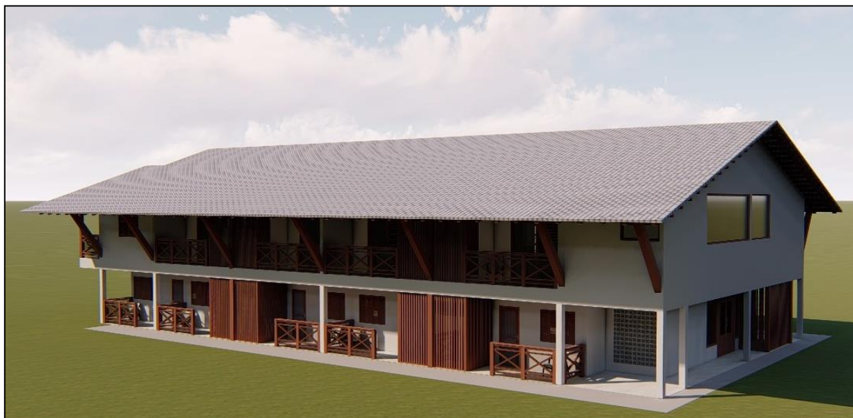
Vista Bloco 400

OBJETO: OBRA DE REFORMA DO BLOCO 400 – BOÉ – APARTAMENTOS DO HOTEL SESC PORTO CERCADO, COM 18 APARTAMENTOS.